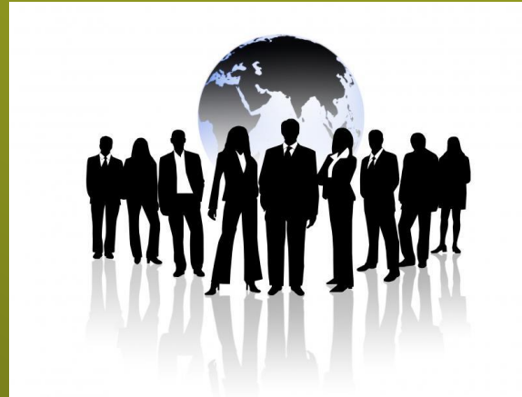
Business man/ women